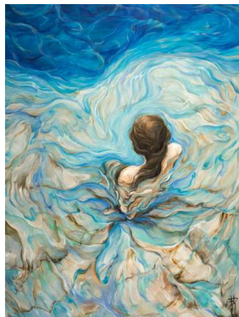
La fleur de la Méditerranée Huile sur toile 2024 80x60cm