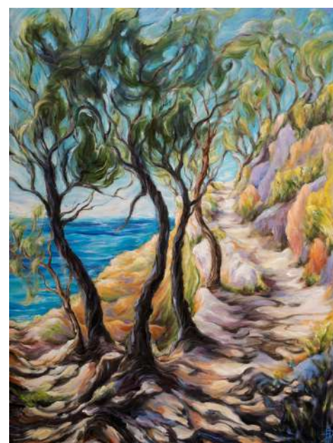
L'ascension Huile sur toile 2024 80x60cm