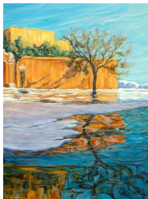
Le miroir de l'inconnu Huile sur toile 2024 80x60cm