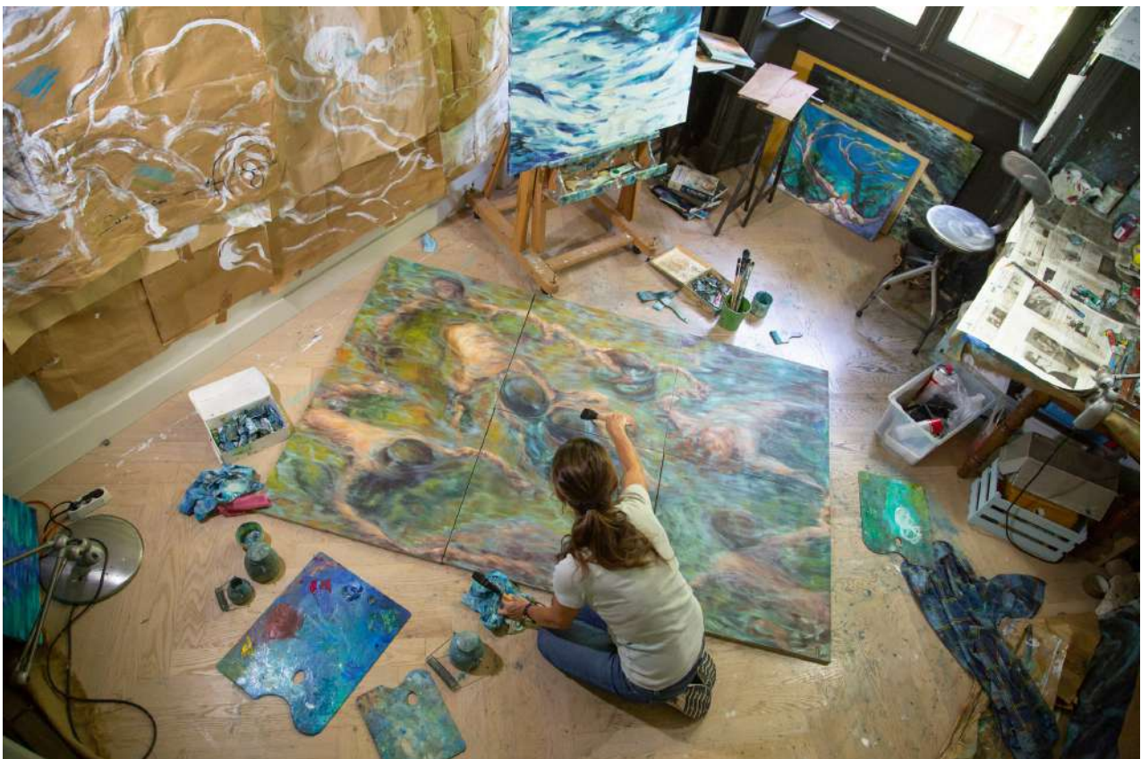
Rossella dans son atelier

Ses œuvres font partie d'importantes collections publiques et privées dans le monde entier.